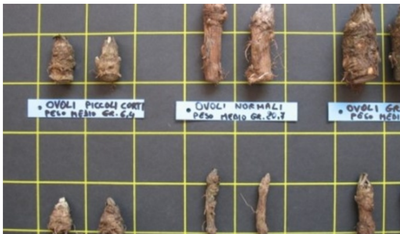
Carciofo Spinoso sardo - Foto