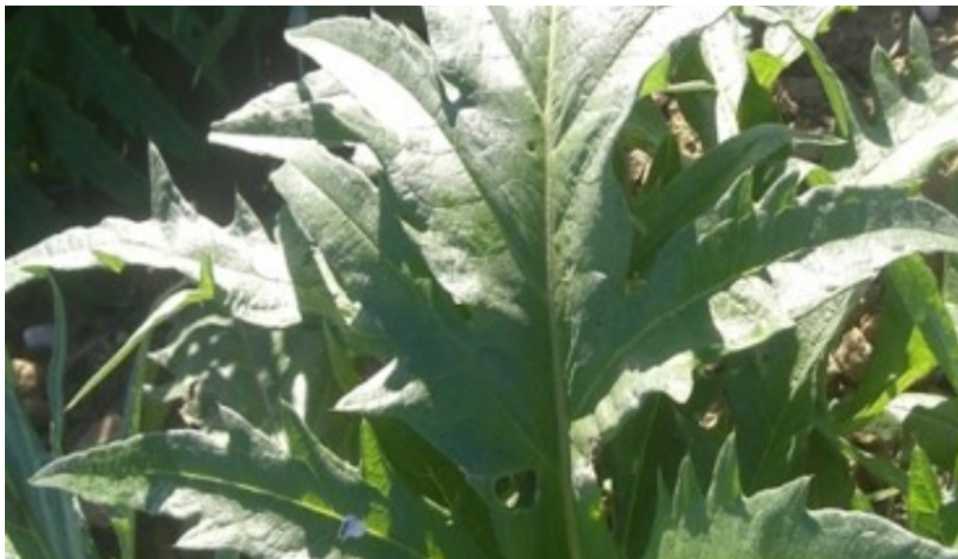
Carciofo Spinoso sardo - Foto