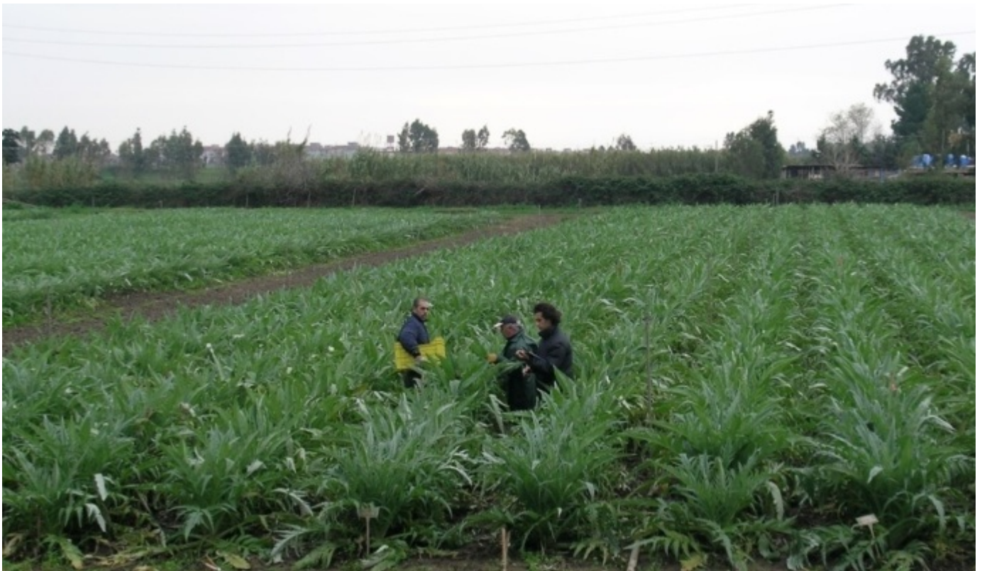
Carciofo Spinoso sardo - Foto

Produzione: la raccolta può avere inizio a metà ottobre con i trapianti precocissimi che avvengono nel mese di luglio. Con i trapianti del mese di agosto si ottengono produzioni precoci raccolte a novembre-dicembre infine con i trapianti autunnali si ottengono produzioni più tardive nei mesi di gennaio-febbraio.