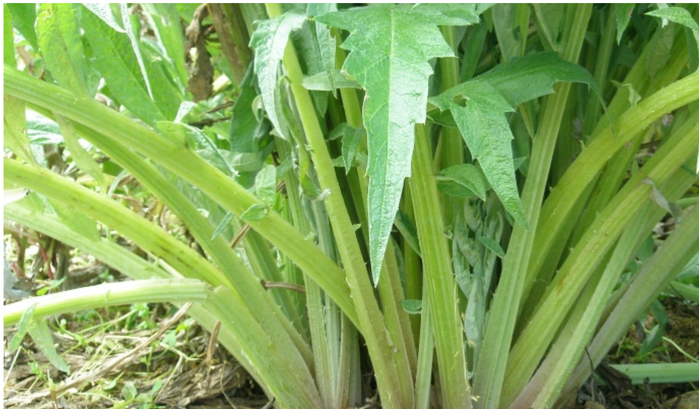
Carciofo Spinoso sardo - Foto