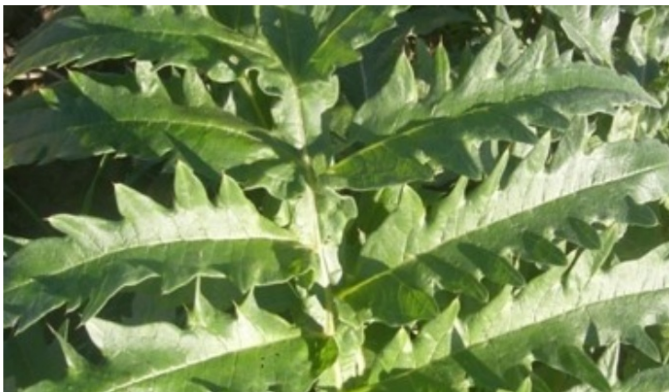
Carciofo Spinoso sardo - Foto