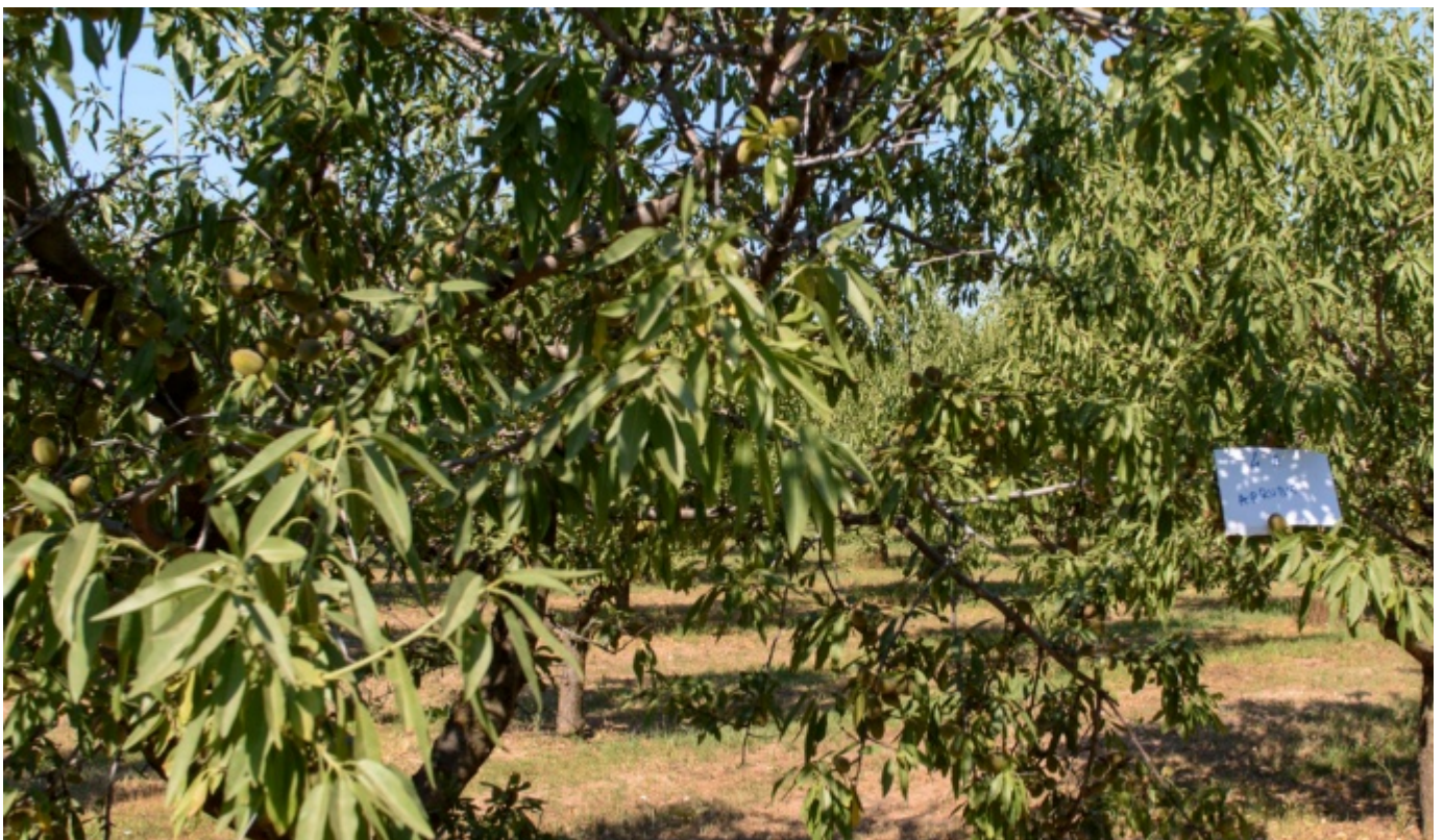
Mandorlo Arrubia pianta intera - Foto