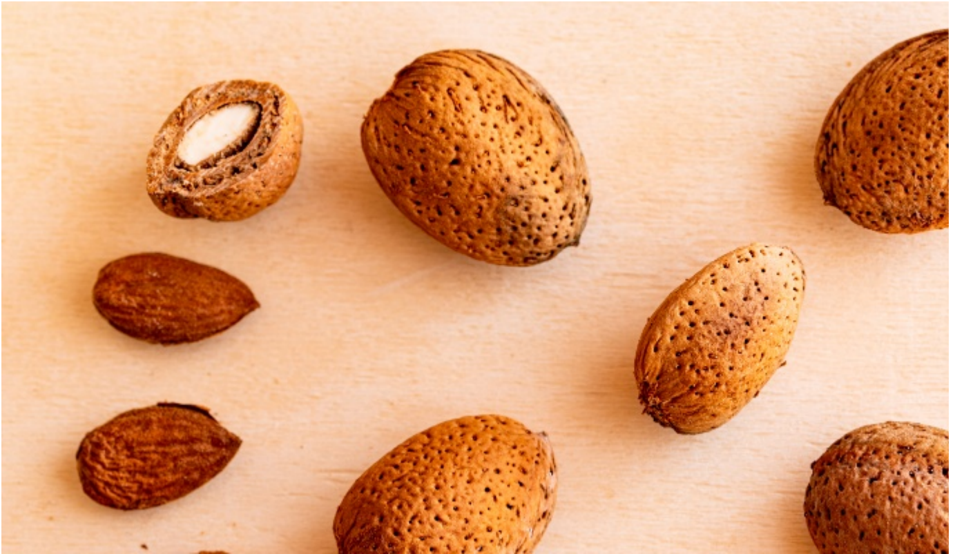
Mandorlo Arrubia - Dettaglio Frutti - Foto