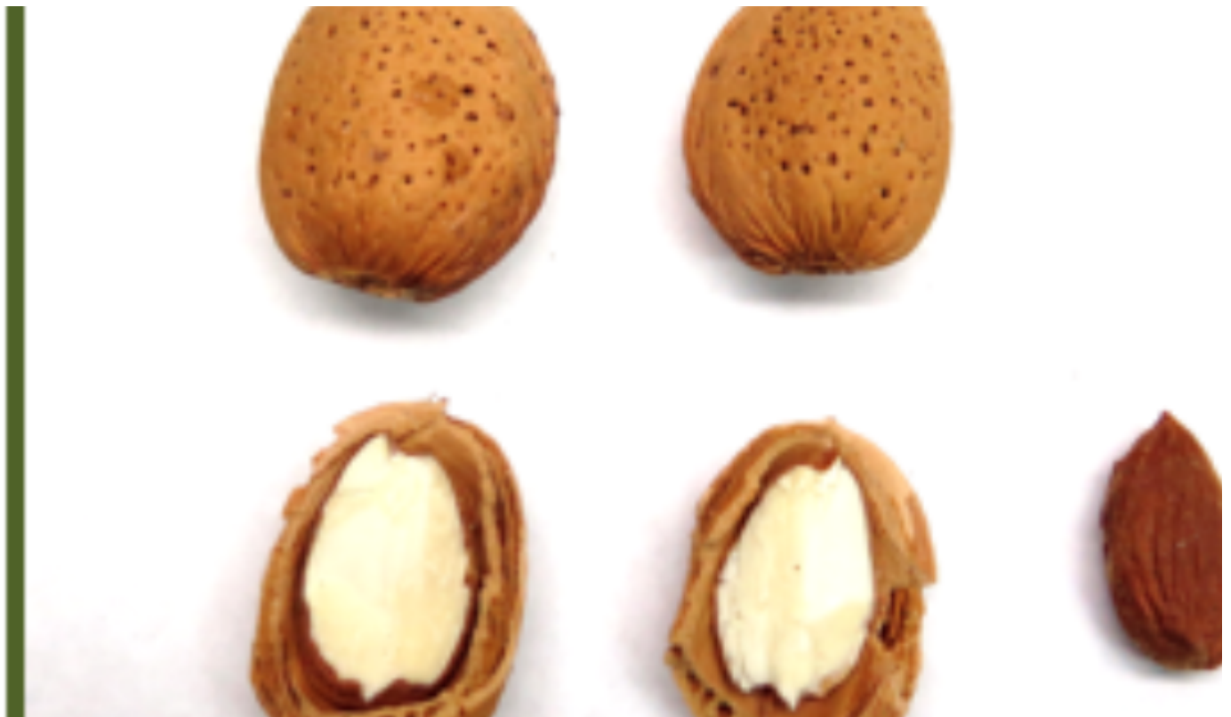
Mandorlo Arrubia frutto sezione - Foto