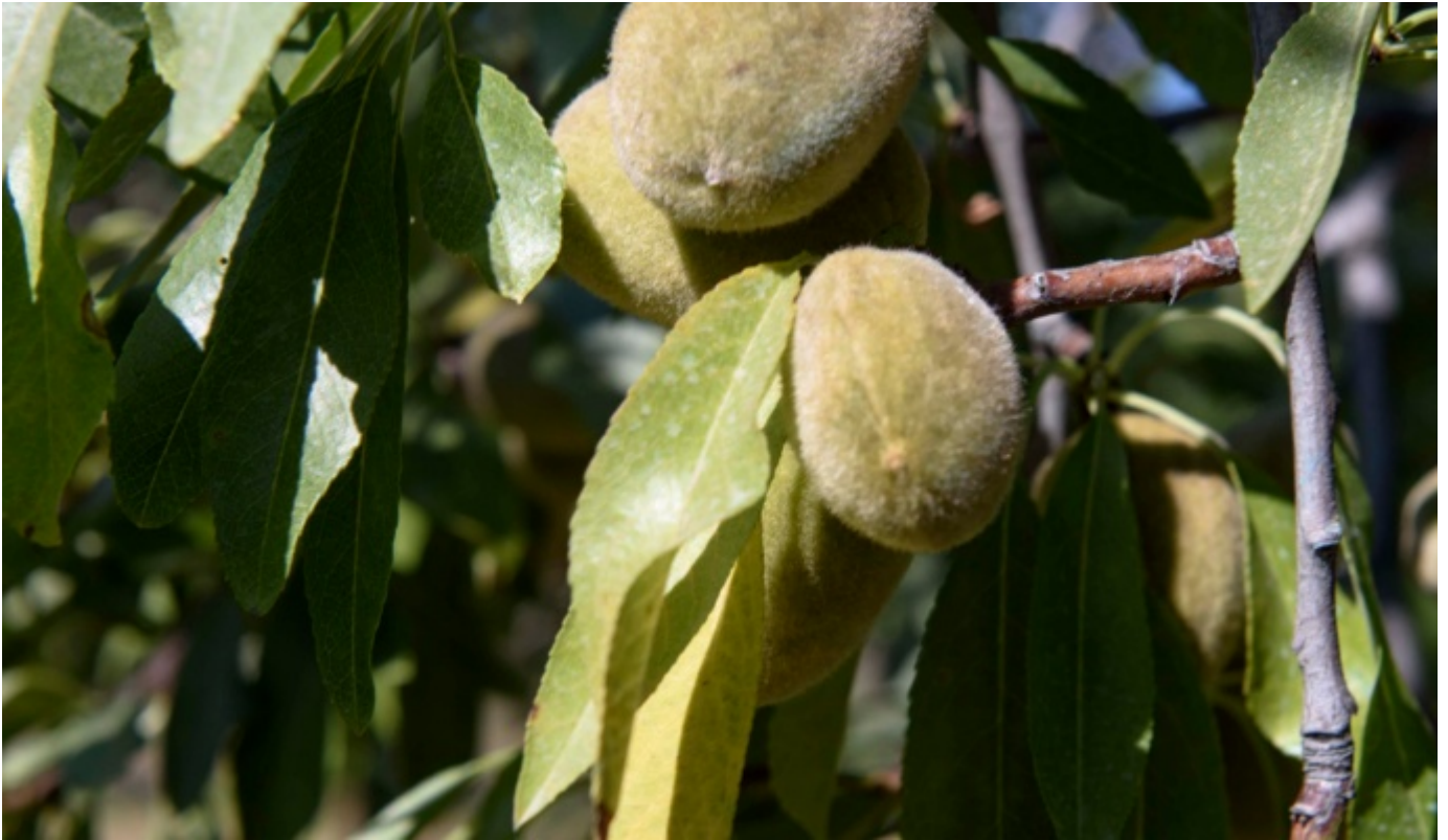
Mandorlo Arrubia - Dettaglio frutti sulla pianta - Foto