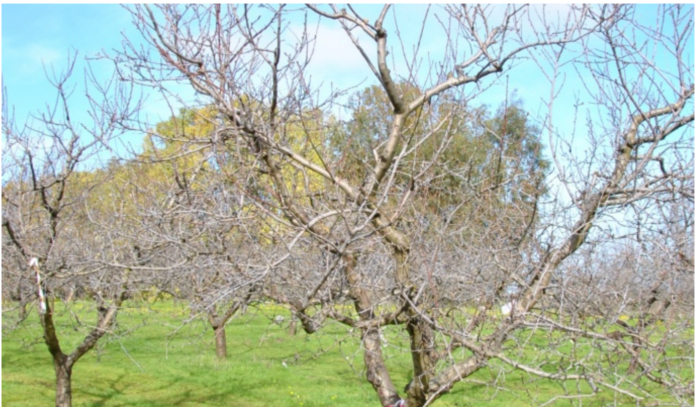
Mandorlo Arrubia pianta intera - Foto