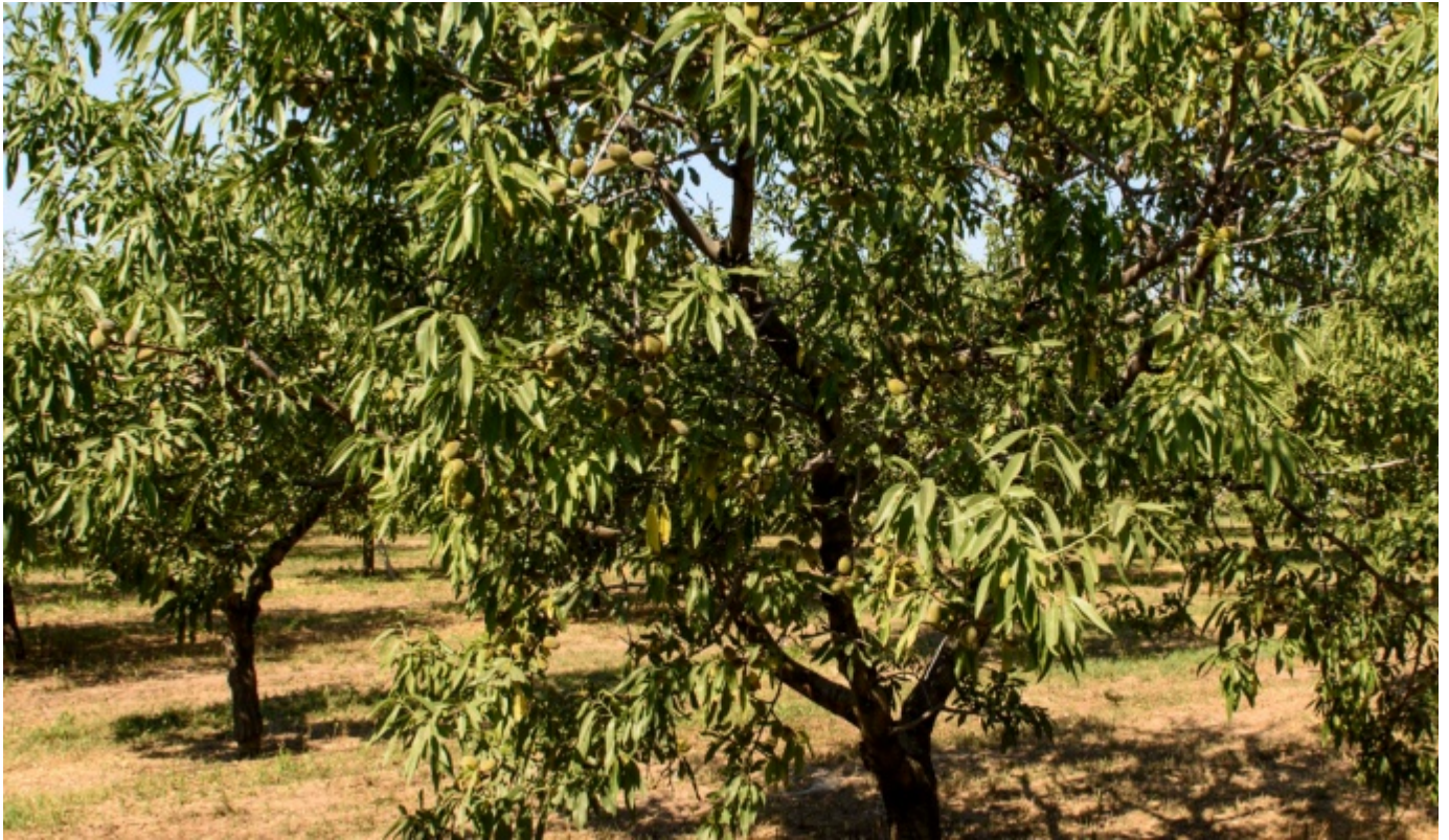
Mandorlo Arrubia pianta intera - Foto