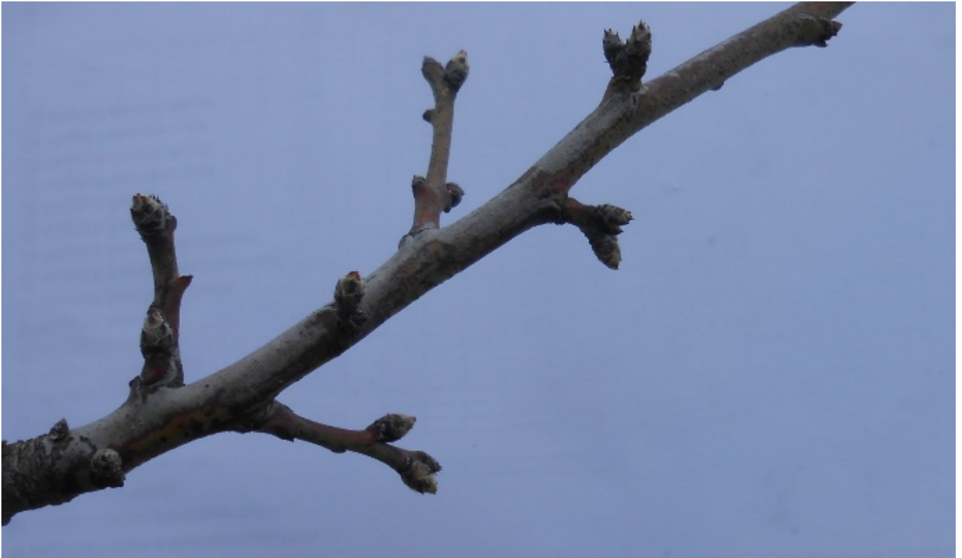
Mandorlo Arrubia dettaglio ramo - Foto