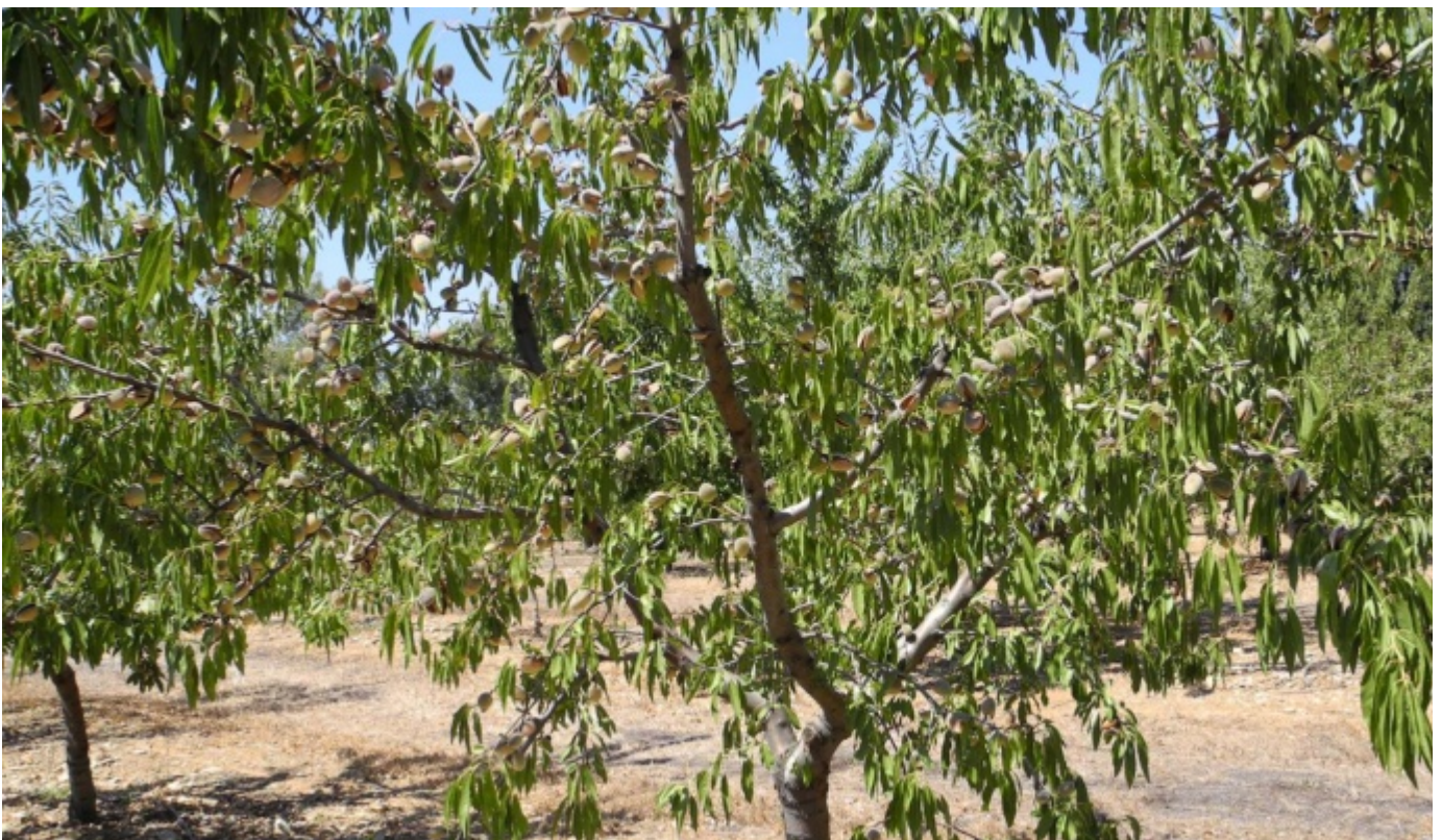
Mandorlo Arrubia pianta intera carica - Foto