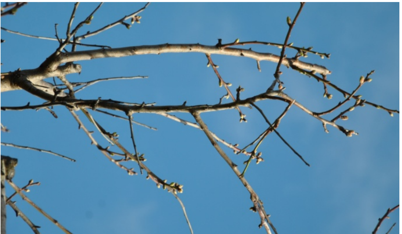
Mandorlo Arrubia ramo - Foto